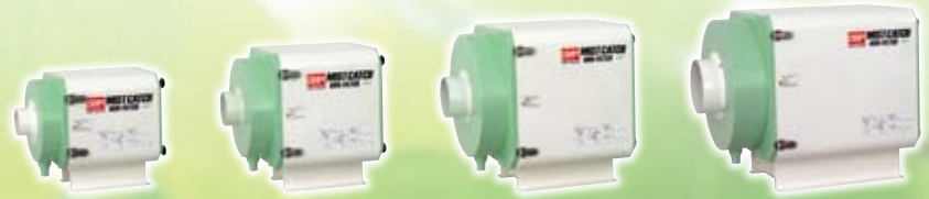
OMC-N105 (-CE) OMC-N110 (-CE) OMC-N115 (-CE) NEW OMC-N125