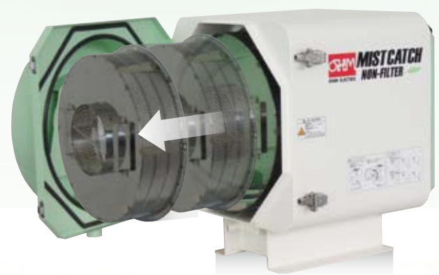
捕集ユニットは簡単に引き出せます。