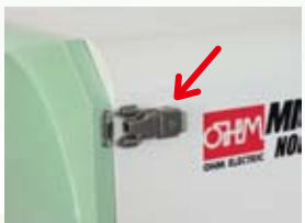
キャッチクリップをはずして扉を開くだけ！