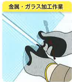
金属・ガラス加工作業