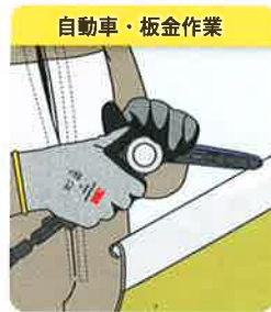
自動車・板金作業